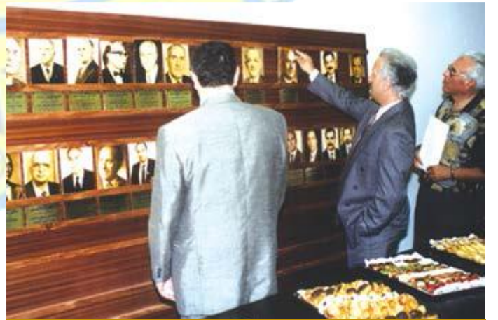
إفتتاح صالة الحكام السابقين في مقر الحاكمية ١٩٩٧