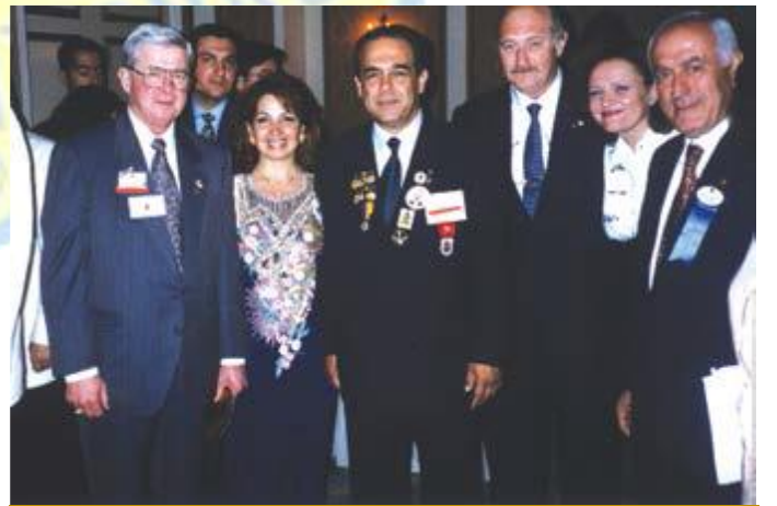
تموز ١٩٩٧ في فيلادلفيا مع الرئيس الدولي