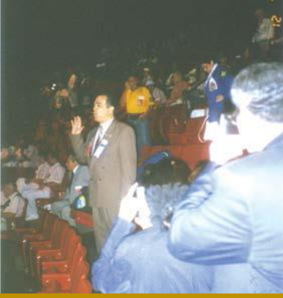
الحاكم المنتخب البير شهاب خلال ادائه القسم في مونتريال تموز ١٩٩٦