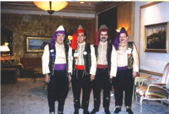
الوفد اللبناني الى فيلادلفيا اميركا سنة ١٩٩٧