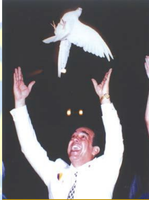
في حفلة التسليم والتسلم الأربعاء الواقع فيه ١٤ آب ١٩

بعد تسلمه حاكميته في مدينة مونتريال – كندا قام بتروّس عدة مؤتمرات خارج لبنان وخاصة في المملكة المغربية وفي مدينة دوفيل في فرنسا وفيلادلفيا في أميركا. خطابه فاقت الخمسمائة وهو يقوم بترتيبها وإعدادها في مجلد للذكرى ومن أهم أقواله إثر فقدانه لوالده : « غيابك جرح الكون الذي لا يحد .