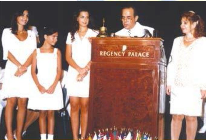
حفلة التسليم والتسلم الحاكم مع عائلته