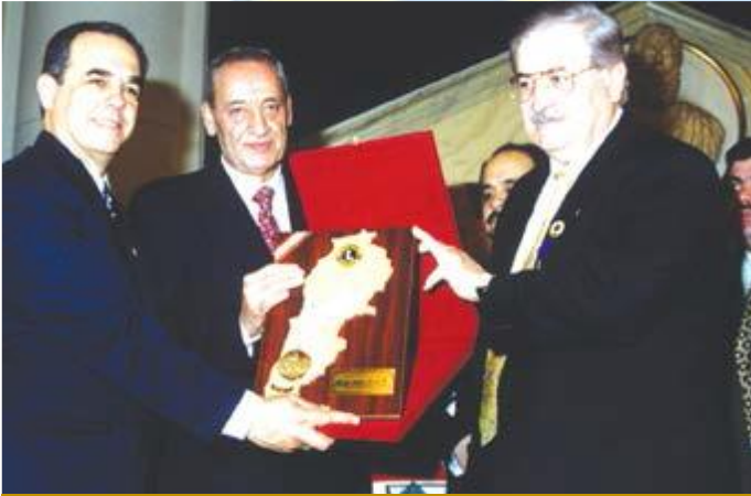
احتفال للجنة العلاقات الدولية بحضور الرئيس نبيه بري في يوم السلام العالمي