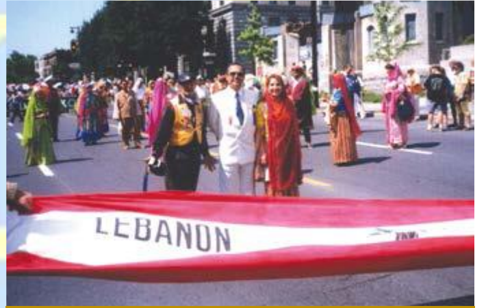
الوفد اللبناني في مونتريال سنة ١٩٩٩